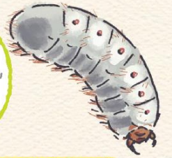
かなぶんのようちゅう