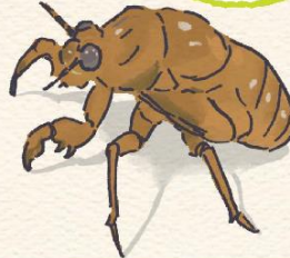
せみのようちゅう